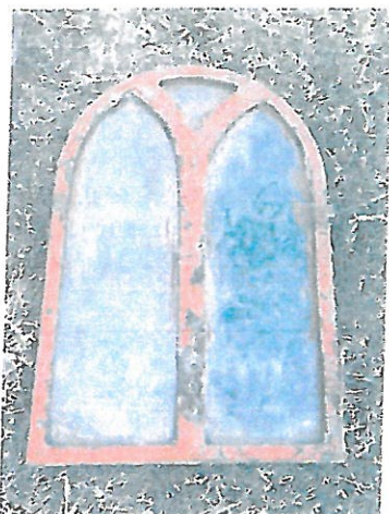
Fot. 2 Kapliczka w Juniewiczach, oryginalne okienko wykonane z metalowych profili pierwotnie umieszczone w niszy części cokołowej.

Trzon stanowią cztery filary kanelowane stanowiące podstawę dla zadaszania. Tylne ściana jest zamurowana, trzy boczne otwarte, przeszklone. Część cokołową stanowi wysoki postument z wyprofilowanymi prostokątnymi wnękami z trzech stron, a od strony frontalnej znajduje się mała wnęka przeszklona, w której umieszczono niewielkich rozmiarów figurkę. Obecnie od frontu nisza zamknięta jest wtórnym oknem drewnianym, pierwotnie była zamknięta łukowo okienkiem oprawionym w metal z łukowymi szprosami w stylu neogotyckim.