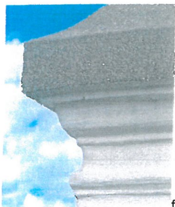
fot 6, Gzyms pomiędzy kondygnacjami, pokryty wtórnie żywiczną masą

Obiekt zatracił zupełnie swój pierwotny walor, a stan techniczny oryginalnych tynków jest nieczytelny pod warstwą nowych cementowo-wapiennych tynków i żywicznych warstw strukturalnych.