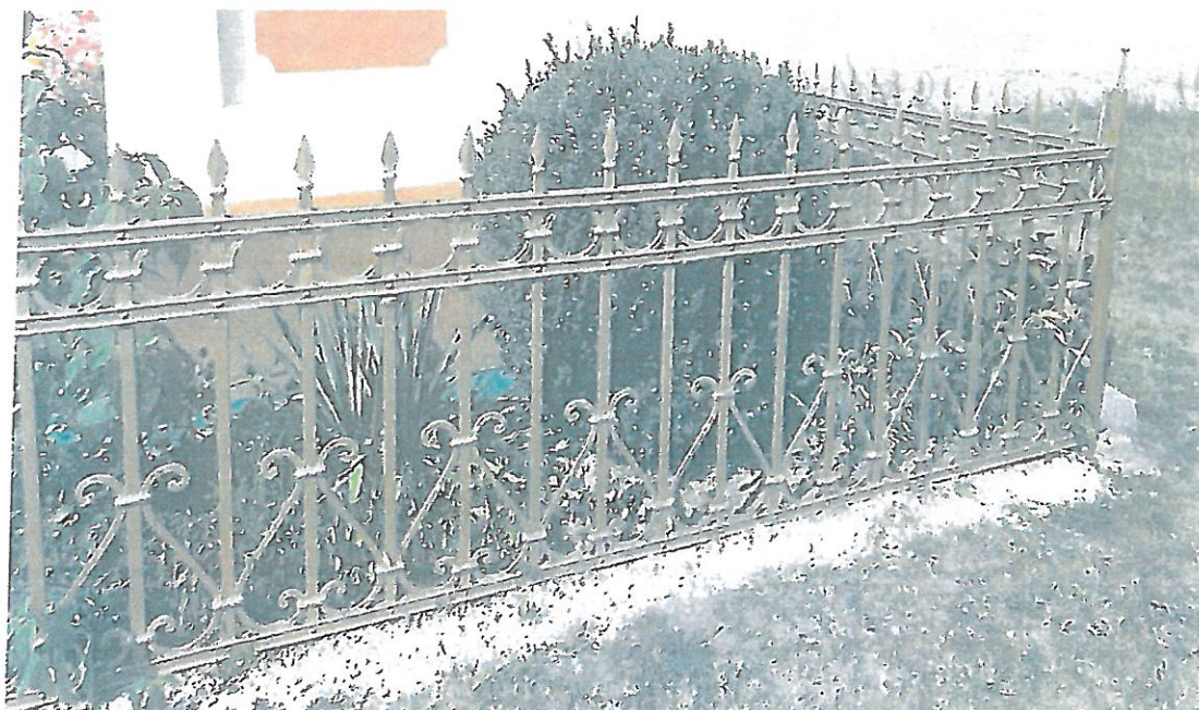
Fot. 5 kapliczka w Juniewiczach, fragment ogrodzenia żeliwnego.