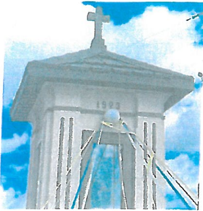
Fot. 3 Górna część kapliczki, widoczne wtórnie zamontowane drewniane okna prostokątne.

Całość nakryta jest czterospadowym daszkiem na szczycie którego znajduje się krzyż. Krzyż który znajduje się tam obecnie jest wykonany z cementu, wydaje się wtórny ale na obecnym etapie nie można tego potwierdzić. Daszek współcześnie wykonano z blachodachówki z gąsiorami oraz z drewnianą podbitką od spodu. Jest to nakrycie całokowicie wtórne i trudno jest ocenić jakie było pierwotnie. Brak przekazów źródłowych oraz śladów poprzedniego nakrycia. W tylnej ścianie górnej kondygnacji wykonano otwór wentylacyjny.