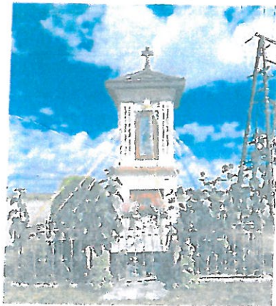
Fot. 1 Kapliczka w Juniewiczach, stan przed konserwacją, widok ogólny, strona frontalna.