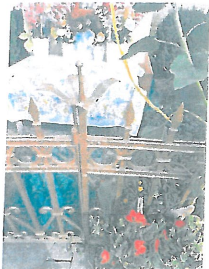
Fot 4. Kapliczka w Juniewiczach, fragment metalowego ogrodzenia, zachowany element ozdobny.

Całe założenie otoczone jest płotkiem żeliwnym, modułowym, ozdobnym. Od strony frontalnej są drzwiczki z zamkiem. W narożach na górnej części filaru znajdował się cztero płatkowy metalowy kwiat, który zachował się po prawej stronie wejściowych drzwiczek.