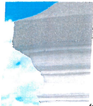
fot 6, Gzyms pomiędzy kondygnacjami, pokryty wtórnie żywiczną masą

Obiekt zatracił zupełnie swój pierwotny walor, a stan techniczny oryginalnych tynków jest nieczytelny pod warstwą nowych cementowo-wapiennych tynków i żywicznych warstw strukturalnych.