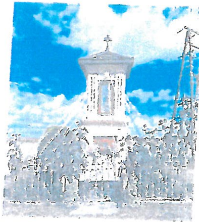
Fot. 1 Kapliczka w Juniewiczach, stan przed konserwacją, widok ogólny, strona frontalna.