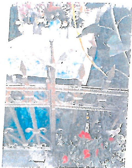
Fot 4. Kapliczka w Juniewiczach, fragment metalowego ogrodzenia, zachowany element ozdobny.

Całe założenie otoczone jest płotkiem żeliwnym, modułowym, ozdobnym. Od strony frontalnej są drzwiczki z zamkiem. W narożach na górnej części filaru znajdował się cztero płatkowy metalowy kwiat, który zachował się po prawej stronie wejściowych drzwiczek.