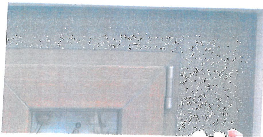
Fot.7 Fragment górnej części trzonu, widoczne spękania gzymsu.

Profilowanie gzymsów jest zatarte grubą warstwą szlicht i wieloma warstwami farby. Nielicznie w górnej części pojawiły się już spękania strukturalne tynków, które będą niebawem przyczyną odspojień i zniszczeń