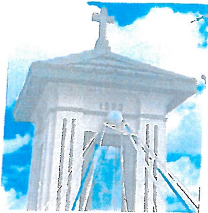
Fot. 3 Górna część kapliczki, widoczne wtórnie zamontowane drewniane okna prostokątne.

Całość nakryta jest czterospadowym daszkiem na szczycie którego znajduje się krzyż. Krzyż który znajduje się tam obecnie jest wykonany z cementu, wydaje się wtórny ale na obecnym etapie nie można tego potwierdzić. Daszek współcześnie wykonano z blachodachówki z gąsiorami oraz z drewnianą podbitką od spodu. Jest to nakrycie całokowicie wtórne i trudno jest ocenić jakie było pierwotnie. Brak przekazów źródłowych oraz śladów poprzedniego nakrycia. W tylnej ścianie górnej kondygnacji wykonano otwór wentylacyjny.