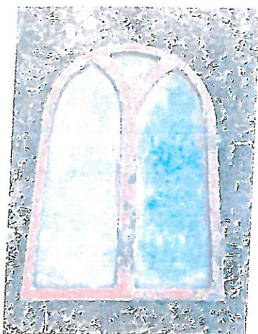
Fot. 2 Kapliczka w Juniewiczach, oryginalne okienko wykonane z metalowych profili pierwotnie umieszczone w niszy części cokołowej.

Trzon stanowią cztery filary kanelowane stanowiące podstawę dla zadaszania. Tylna ściana jest zamurowana, trzy boczne otwarte, przeszklone. Część cokołową stanowi wysoki postument z wyprofilowanymi prostokątnymi wnękami z trzech stron, a od strony frontalnej znajduje się mała wnęka przeszklona, w której umieszczono niewielkich rozmiarów figurkę. Obecnie od frontu nisza zamknięta jest wtórnym oknem drewnianym, pierwotnie była zamknięta łukowo okienkiem oprawionym w metal z łukowymi szprosami w stylu neogotyckim.